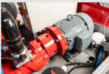
30 kW Elektromotor