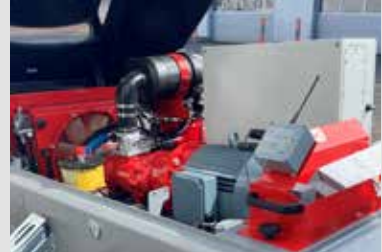
Saubere Anordnung der Komponenten